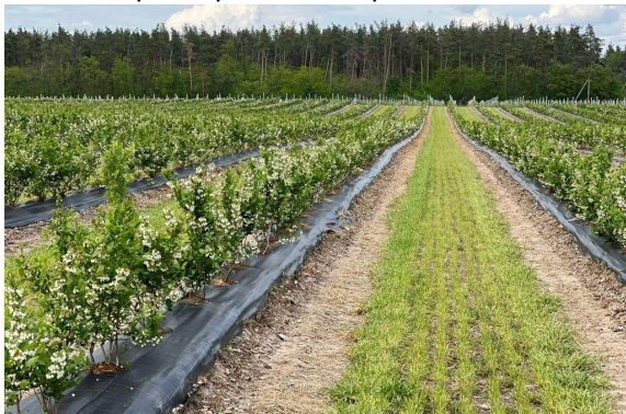
Отличное качество продукции