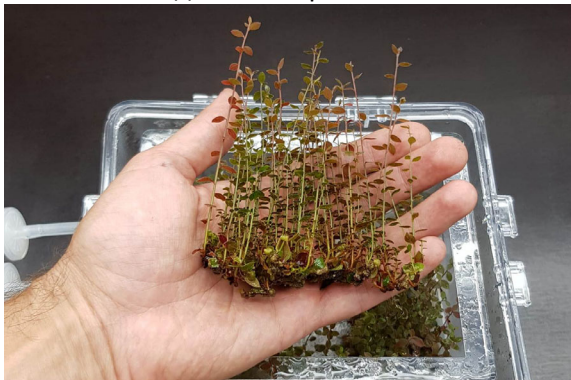
Кассетные саженцы, ячейка 45 мл