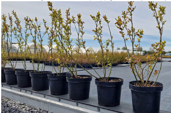
Отгрузка посадочного материала